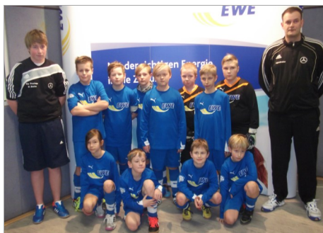
E-Jugend des FSV Garz