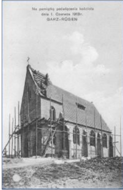
Originalfoto von der Bauphase (1913)

Der Pfarrer Maximilian Kaller (später Bischof von Ermland) war seit 1906 auf der Insel Rügen tätig. Zunächst waren die Gottesdienste in dem Saal des Garzer Gasthofes Rüterbusch (Poggenstraße 1). Danach fanden für die über 800 Gläubigen Gottesdienste über 7 Jahre im